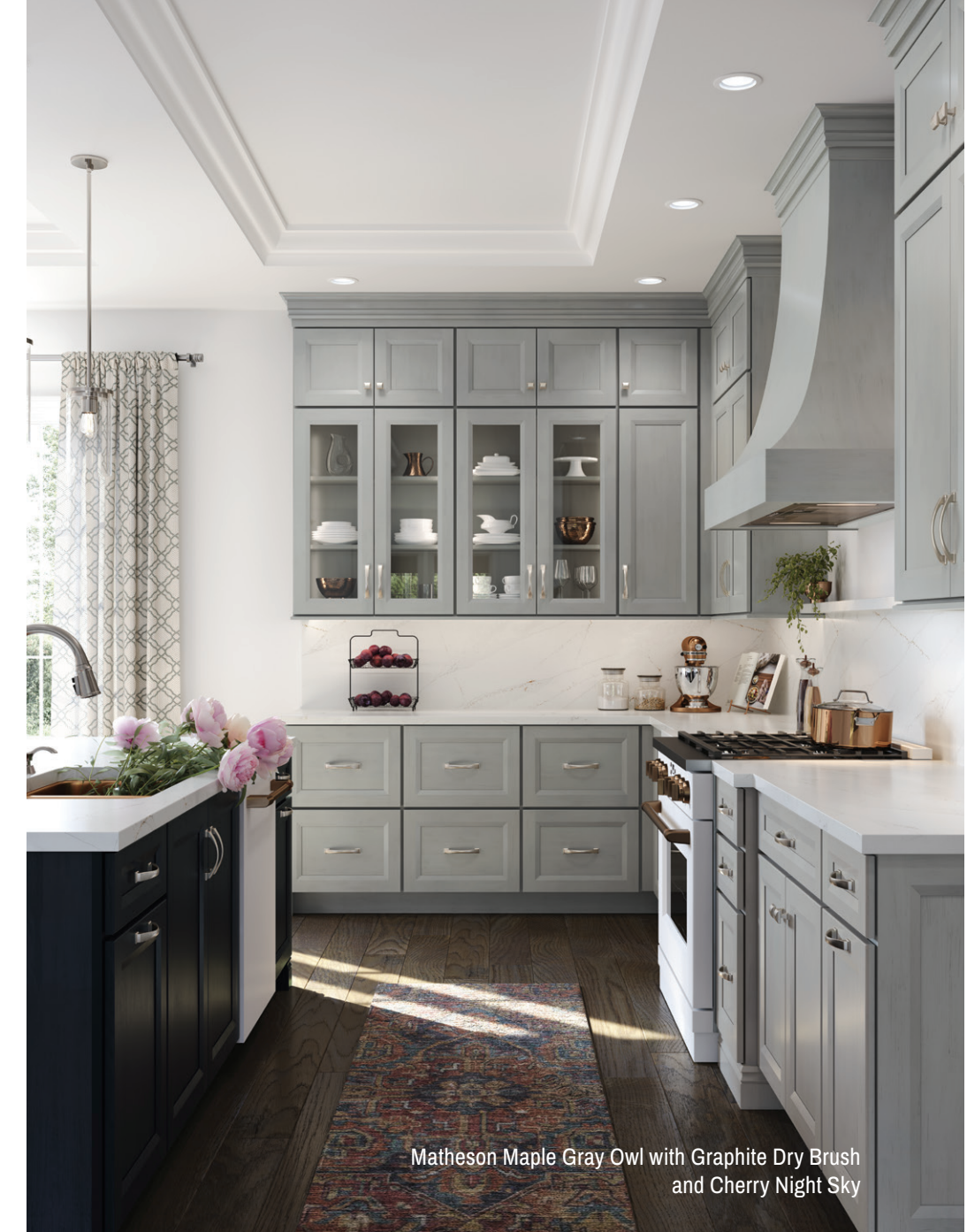
Matheson Maple Gray Owl with Graphite Dry Brush and Cherry Night Sky