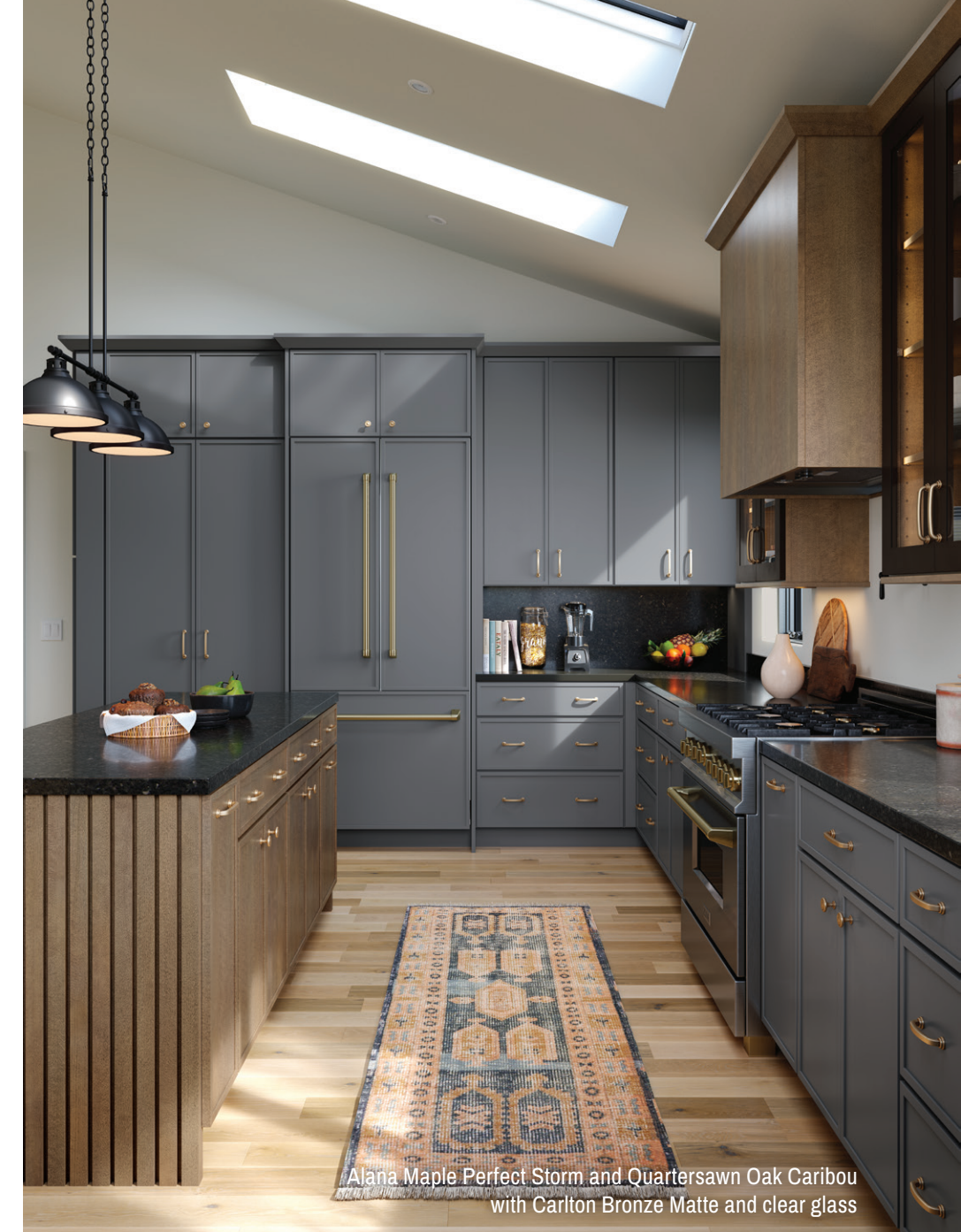
Alana Maple Perfect Storm and Quartersawn Oak Caribou with Carlton Bronze Matte and clear glass