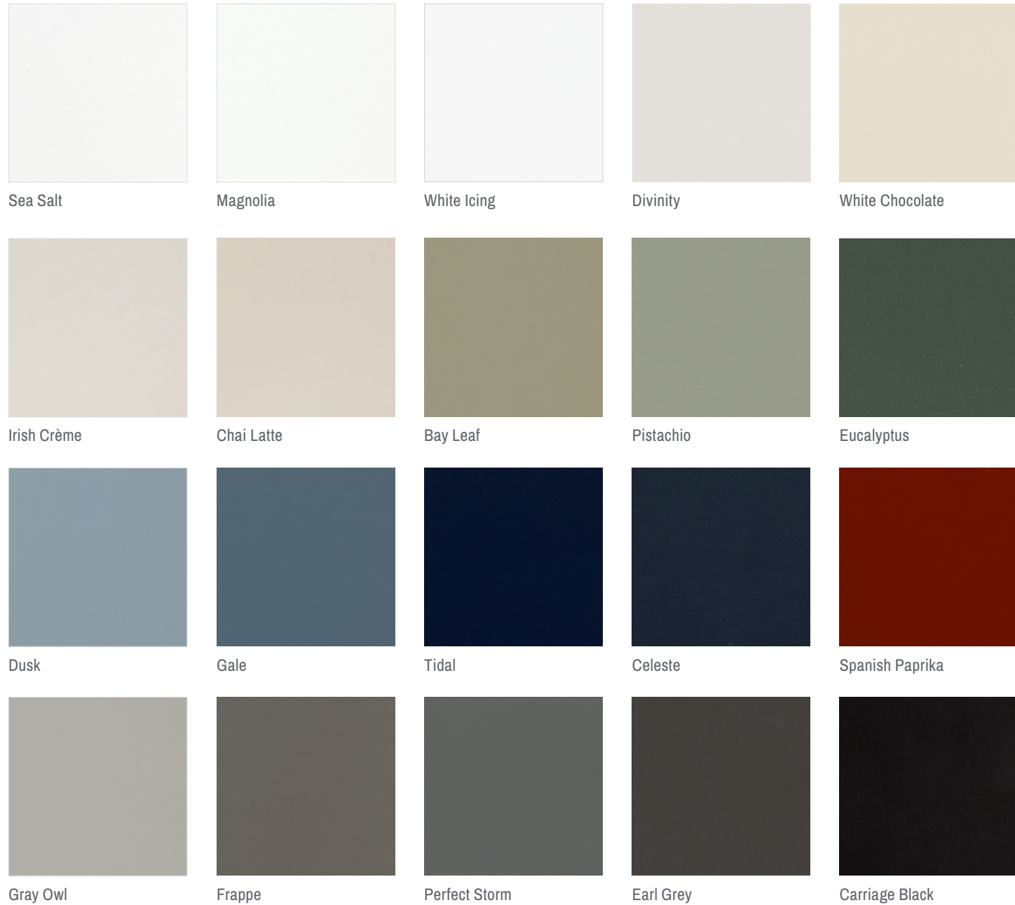
Sea Salt Magnolia White Icing Divinity White Chocolate Irish Crème Chai Latte Bay Leaf Pistachio Eucalyptus Dusk Gale Tidal Celeste Spanish Paprika Gray Owl Frappe Perfect Storm Earl Grey Carriage Black