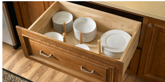
Adjustable Pegboard Organizer Organizador de tablero perforado ajustable