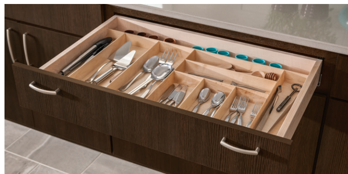
Cutlery Divider Insert Separador de cubiertos