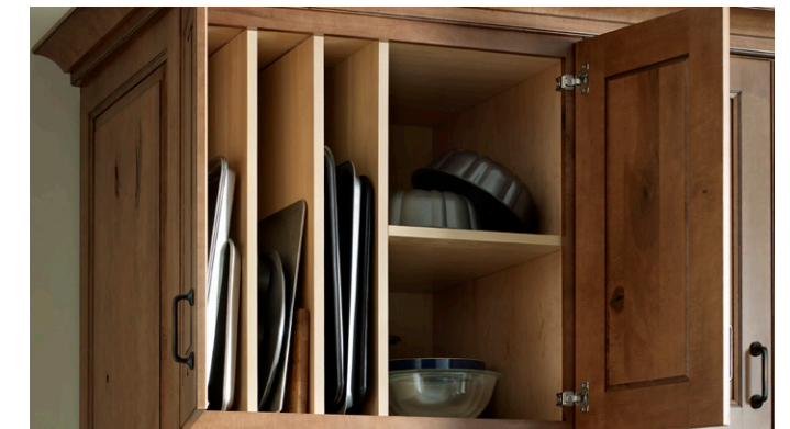
Tray Divider and Shelf Partition Separación de bandejas y estantes