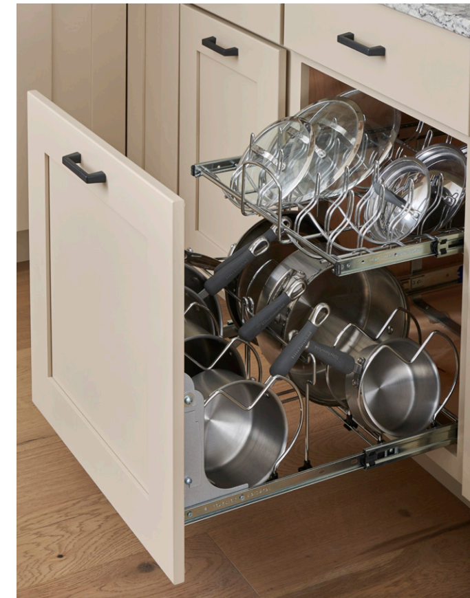
Tiered Pots and Pans Organizer Organizador de ollas y sartenes por niveles