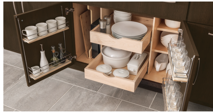
Smart Storage Base Cabinet Gabinete base de almacenamiento inteligente