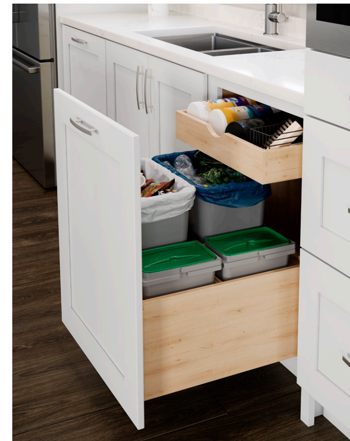
Waste Basket Cabinet Gabinete para el cesto de basura