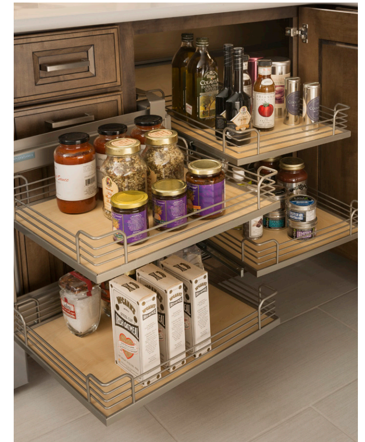
Corner with Full-Access Trays Esquina con bandejas de acceso total