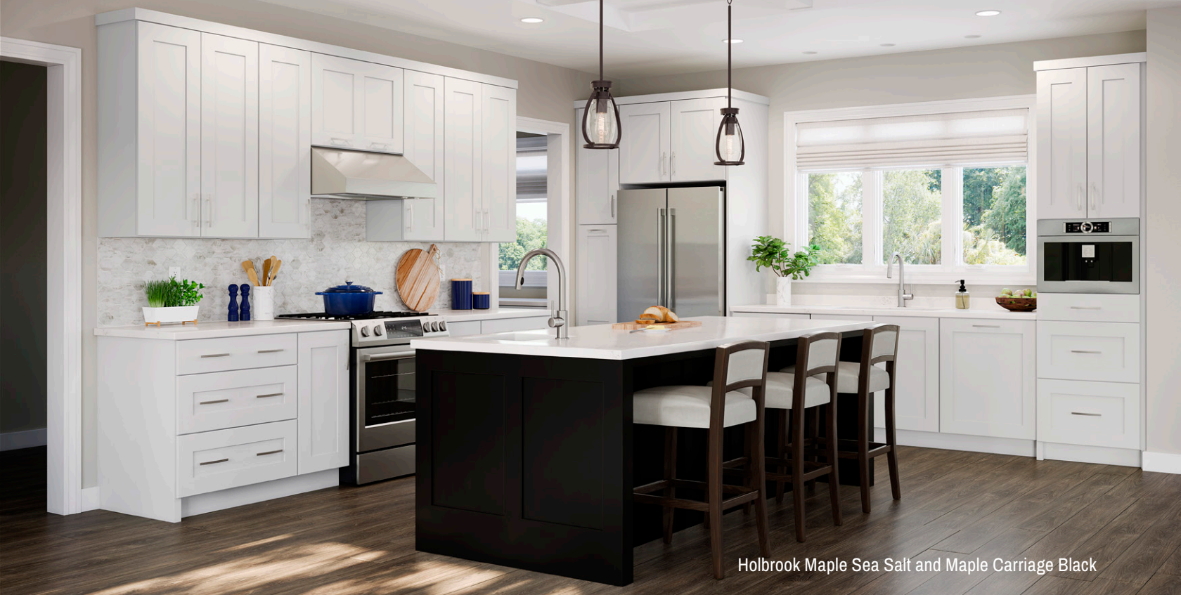
Holbrook Maple Sea Salt and Maple Carriage Black