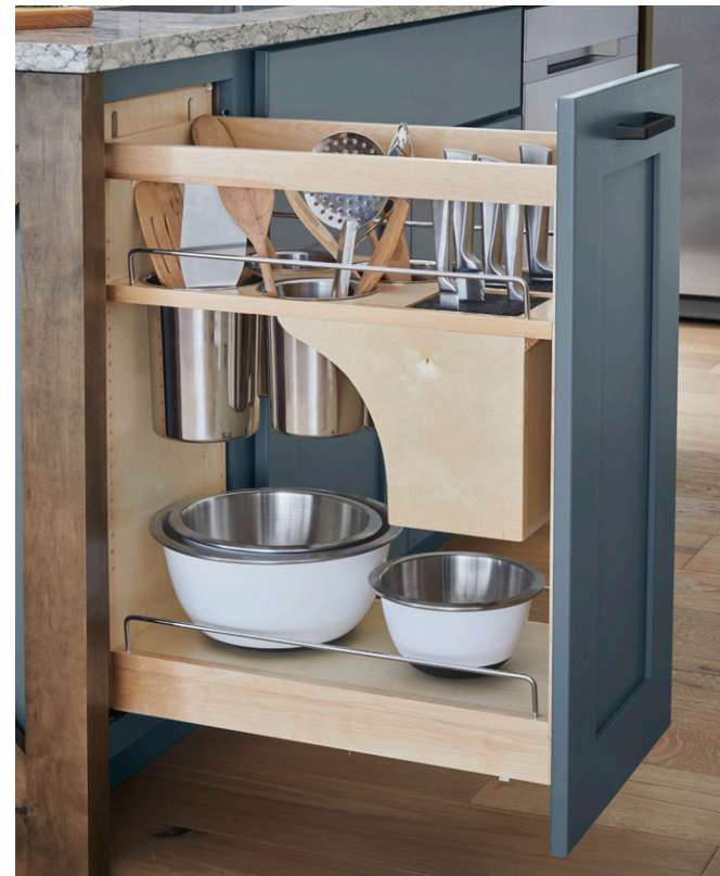
Pull-Out Organizer and Knife Block Organizador extraíble y bloque para cuchillos