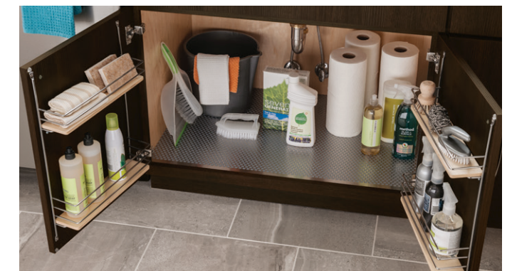
Under Sink Mat and Door Organizers Organizadores bajo el fregadero y en la puerta