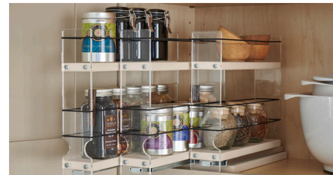
Multi-Level Spice Racks Especieros de varios niveles